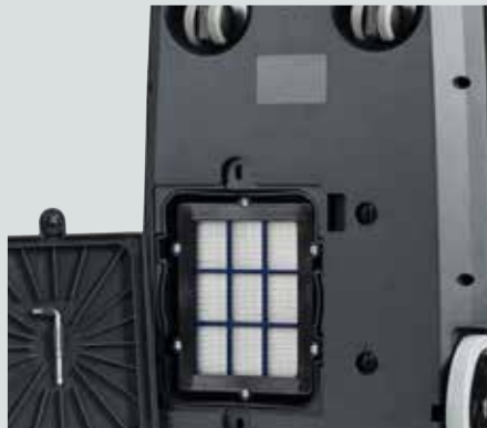
HEPA 13 utblåsningsfilter er standard på alle VP600-modeller