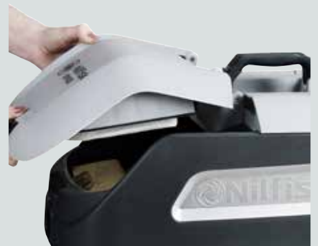
Magnetiske hengsler gir høy driftssikkerhet