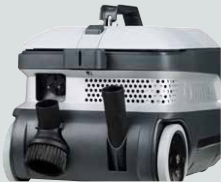
Brukervennlig og lett tilgjengelig tilbehør